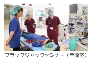
ブラックジャックセミナー（手術室）