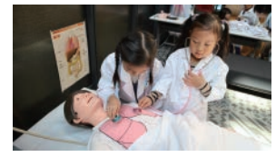
キッズチャレンジ（聴診器を使うよ）

【応募方法】 上記より希望の体験コースA～Dと、時間①か②を選びQRコードから応募してください。 【締め切り】 2023年9月10日(日)まで(先着順) 定員になり次第、締め切ります。 ※当日はテレビ取材されたり、病院のSNSに掲載されることがありますので、参加は保護者の許諾のある方に限らせていただきます。 イベントの詳細は病院ホームページをご覧ください。