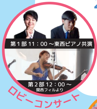
第1部 11:00~東西ピアノ共演