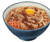
ある日の昼食(牛丼)