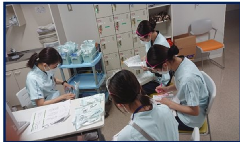
1年生・異働者に対し、 計画的に勉強会を行います。