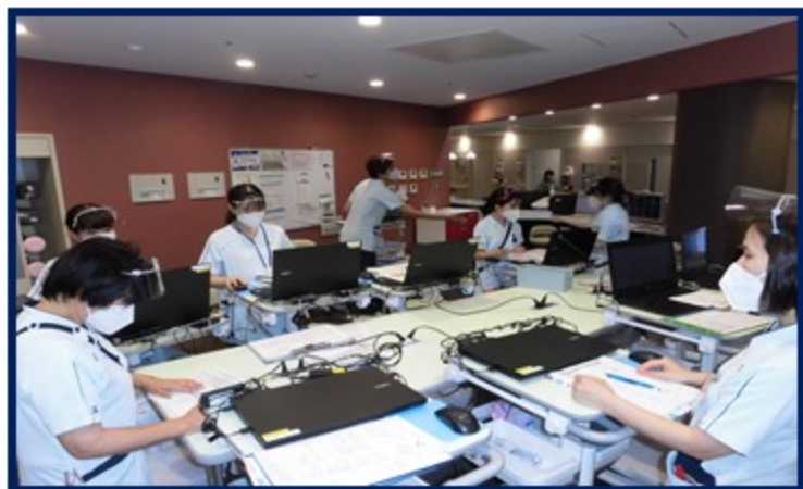
毎日カンファレンスを実施し 情報共有と業務調整をします。

治療は手術療法・化学療法・放射線療法・骨髄移植など幅広く、様々な看護を身に着けることができます。外科的療法で短期間で社会復帰する患者さんのケア、その一方で白血病など入退院を繰り返し、長期に病気と闘病する患者さんのケアが出来る病棟です。